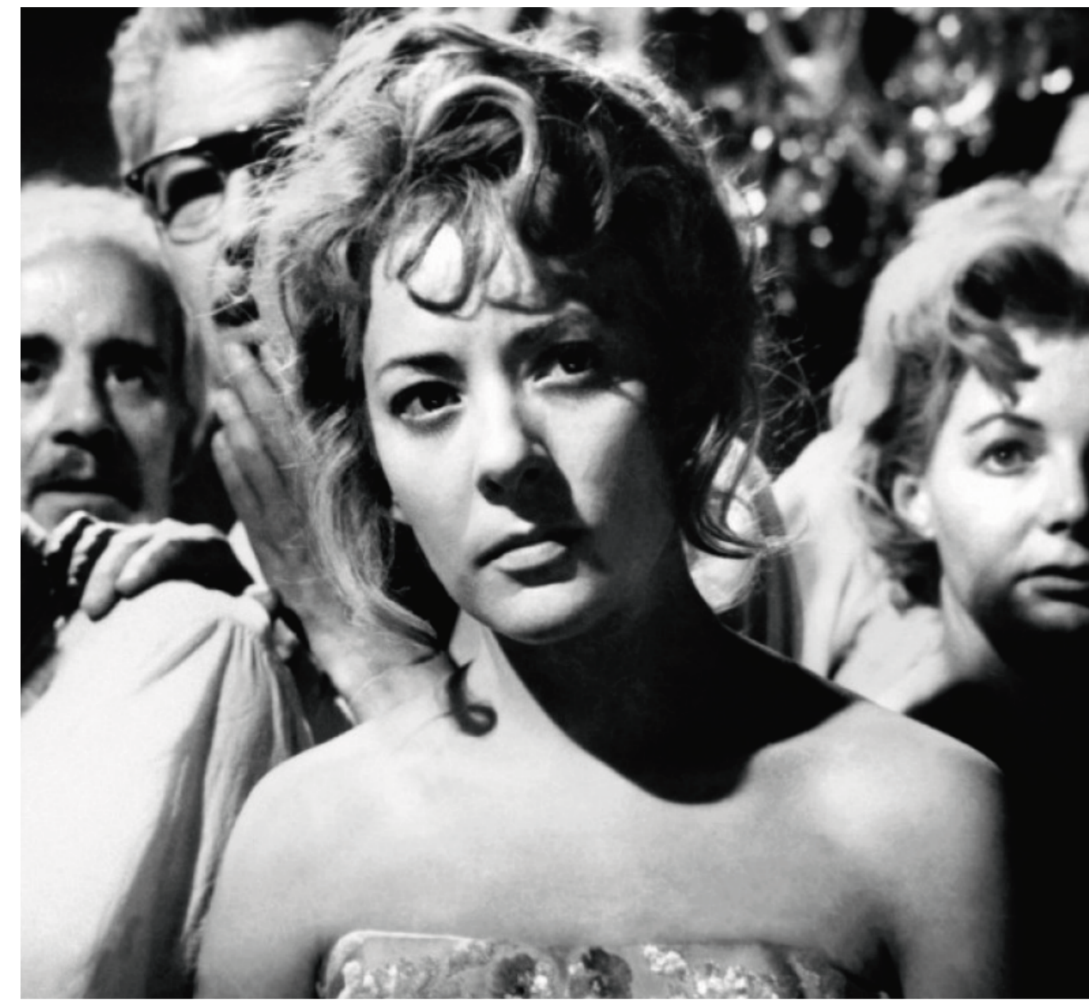
EL ÁNGEL EXTERMINADOR.

6:00 p.m. / EL AMOR Y LA MUERTE. Dir. Arantxa Aguirre. 2018. España. 80 min.