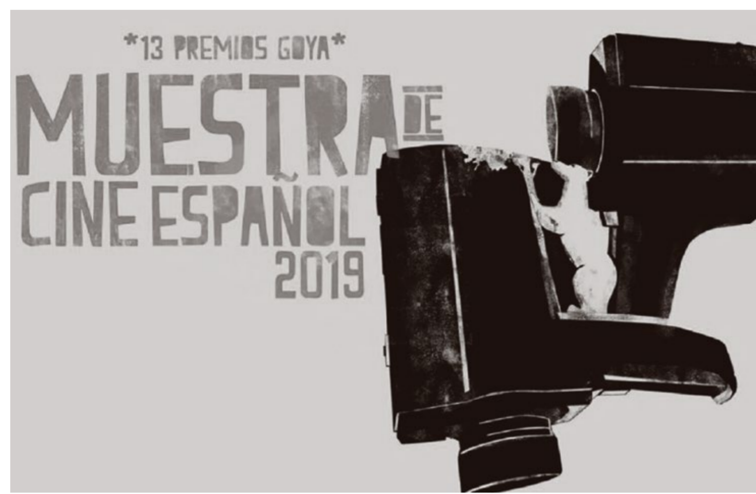
MUESTRA DE CINE ESPAÑOL

*Taquilla abierta 30 minutos antes de cada función. *Cierre de taquilla 10 minutos después de iniciada la función. *Las funciones inician a la hora programada.