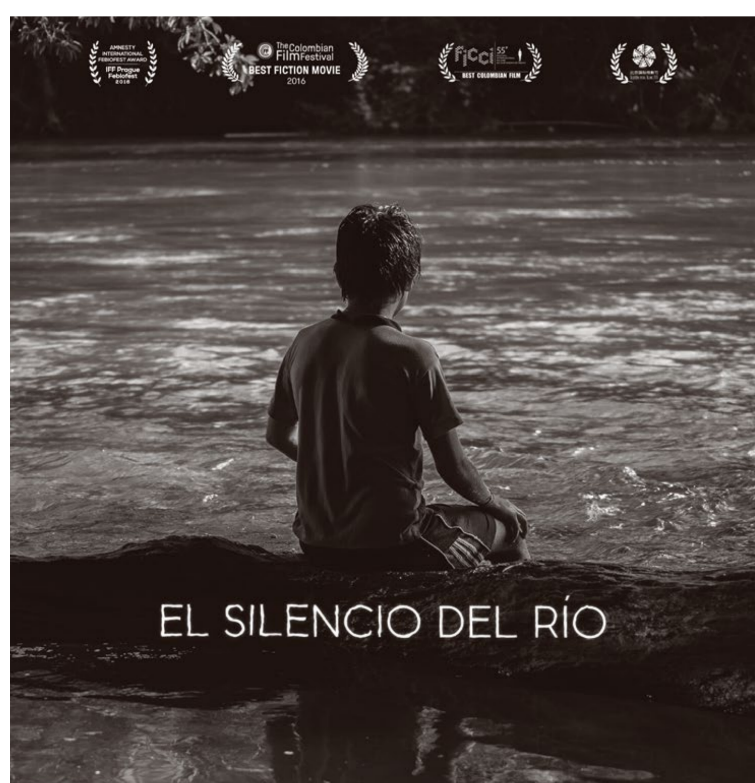
EL SILENCIO DEL RÍO

6:00 p.m. / UN ASUNTO DE FAMILIA. Dir. Hirokazu Koreeda. 2018. Japón. 121 min.