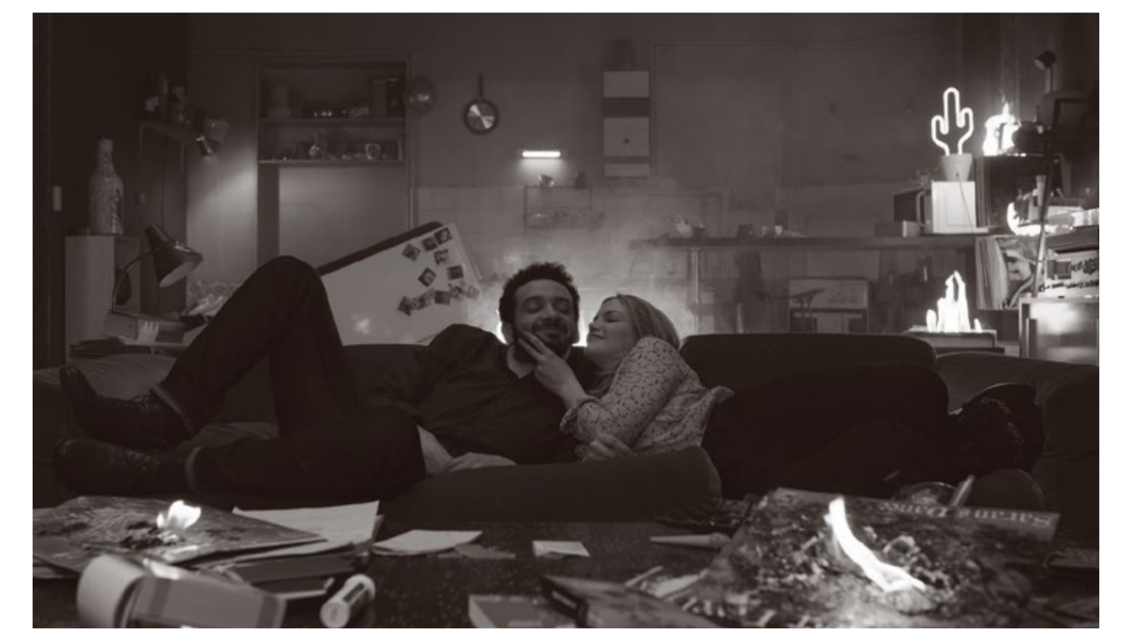
DURMIENDO CON MI MEJOR AMIGA

6:30 p.m. / CLIMAX. Dir. Gaspar Noé. 2018. Francia. 95 min.