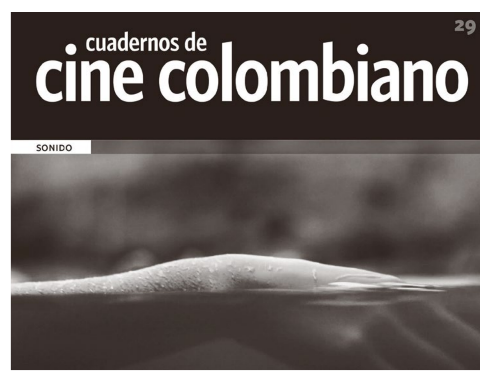
CUADERNOS DE CINE COLOMBIANO

Entrada libre 6:00 p.m. / Cuadernos de Cine Colombiano N° 29. Sonido.