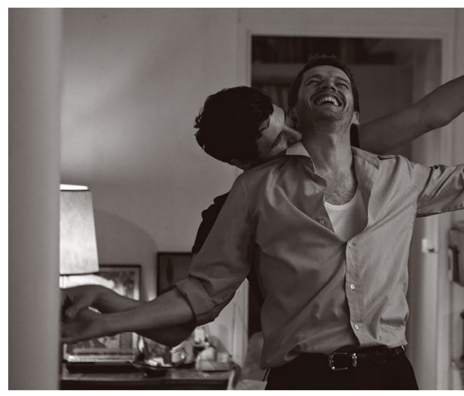
VIVIR DEPRISA, AMAR DESPACIO

6:30 p.m. / 12 DÍAS. Dir. Raymond Depardon. 2018. Francia. 90 min.