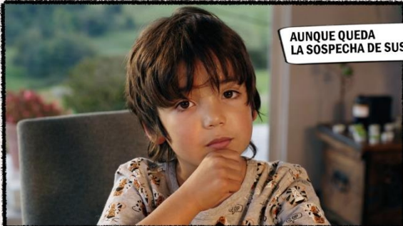
AUNQUE QUEDA LA SOSPECHA DE SUS TOSTADAS.