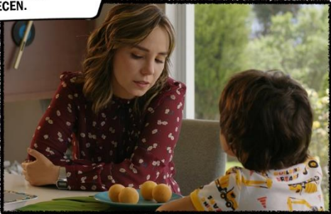
LAS COSAS NO SON LO QUE PARECEN.