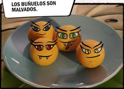
LOS BUÑUELOS SON MALVADOS.