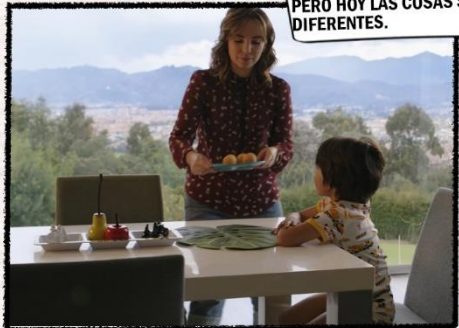
PERO HOY LAS COSAS SON DIFERENTES.