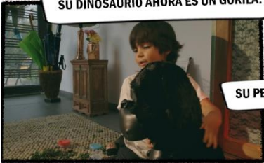
SU PERRO IRA AHORA ES DIFERENTE.