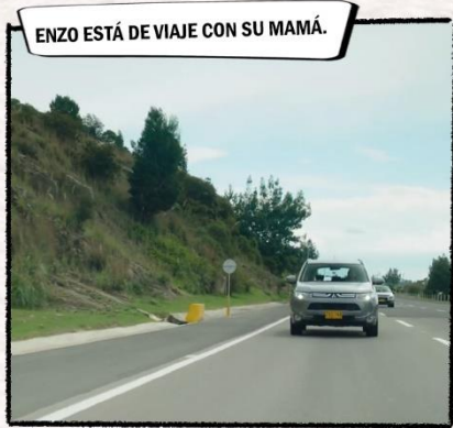
ENZO ESTÁ DE VIAJE CON SU MAMÁ.