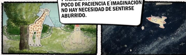
Y TAMBIÉN APRENDE QUE CON UN POCO DE PACIENCIA E IMAGINACIÓN NO HAY NECESIDAD DE SENTIRSE ABURRIDO.