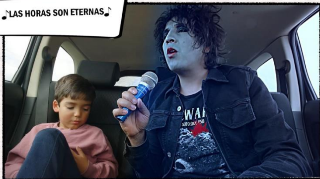
♪ LAS HORAS SON ETERNAS. ♪