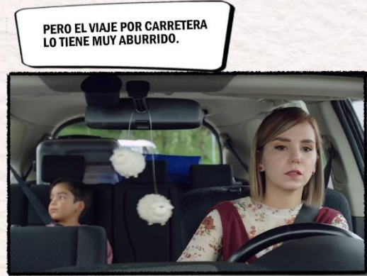
PERO EL VIAJE POR CARRETERA LO TIENE MUY ABURRIDO.