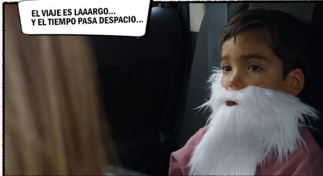
EL VIAJE ES LAAARGO... Y EL TIEMPO PASA DESPACIO...